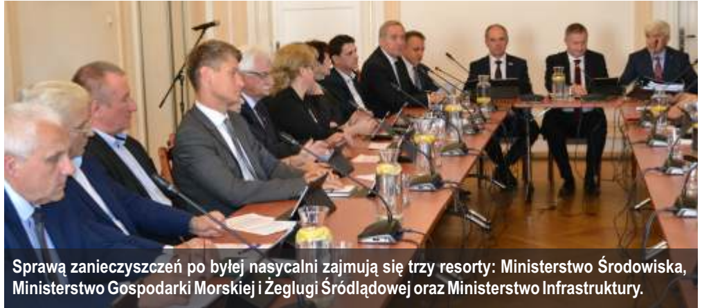
Sprawą zanieczyszczeń po byłej nasycalni zajmują się trzy resorty: Ministerstwo Środowiska, Ministerstwo Gospodarki Morskiej i Żeglugi Śródlądowej oraz Ministerstwo Infrastruktury.

Minister mówił o tym, że temat nasycalni jest jednym z wielu trudnych problemów do rozwiązania. W tym przypadku istotne jest zabezpieczenie i pewność, że zanieczyszczenia nie przedostaną się do warstw wodonośnych oraz monitorowanie zagrożenia. Teren po byłej nasycalni znajduje się blisko ujęć wody i miejsc zamieszkania. Jest to bardzo ważny powód do tego, aby przywrócić ten teren do użytkowania. Sprawą zanieczyszczeń po byłej nasycalni zajmują się trzy resorty: Ministerstwo Środowiska, Ministerstwo Gospodarki Morskiej i Żeglugi Śródlądowej oraz Ministerstwo Infrastruktury.