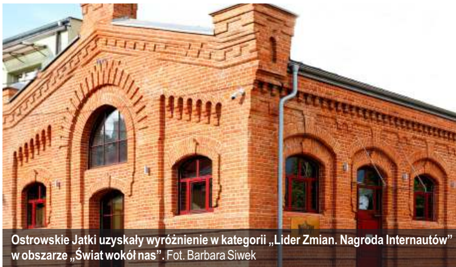
Ostrowskie Jatki uzyskały wyróżnienie w kategorii „Lider Zmian. Nagroda Internautów” w obszarze „Świat wokół nas”.

Organizatorem konkursu była Mazowiecka Jednostka Wdrażania Programów Unijnych. Honorowy patronat nad wydarzeniem objął Marszałek Województwa Mazowieckiego. Samorząd Miasta Ostrow Mazowiecka podjął decyzję o remoncie i modernizacji tego budynku, mając na celu jego ochronę oraz dostosowanie do nowych potrzeb. Przestrzeń dawnej hali targowej służy teraz do celów koncertowych i wystawienniczych, a powstała szklana antresola zwiększa powierzchnię użytkową obiektu i stanowi ważny akcent