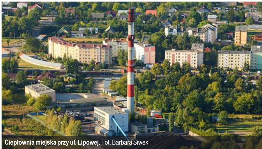
Ciepłownia miejska przy ul. Lipowej.

W ostatnim czasie podjęta została na nowo inicjatywa uregulowania spraw własnościowych dotyczących Zakładu Energetyki Ciepłej w Ostrowi Mazowieckiej pomiędzy Miastem Ostrow Mazowiecka i Spółdzielnią Mieszkaniową „Nasz Dom”.