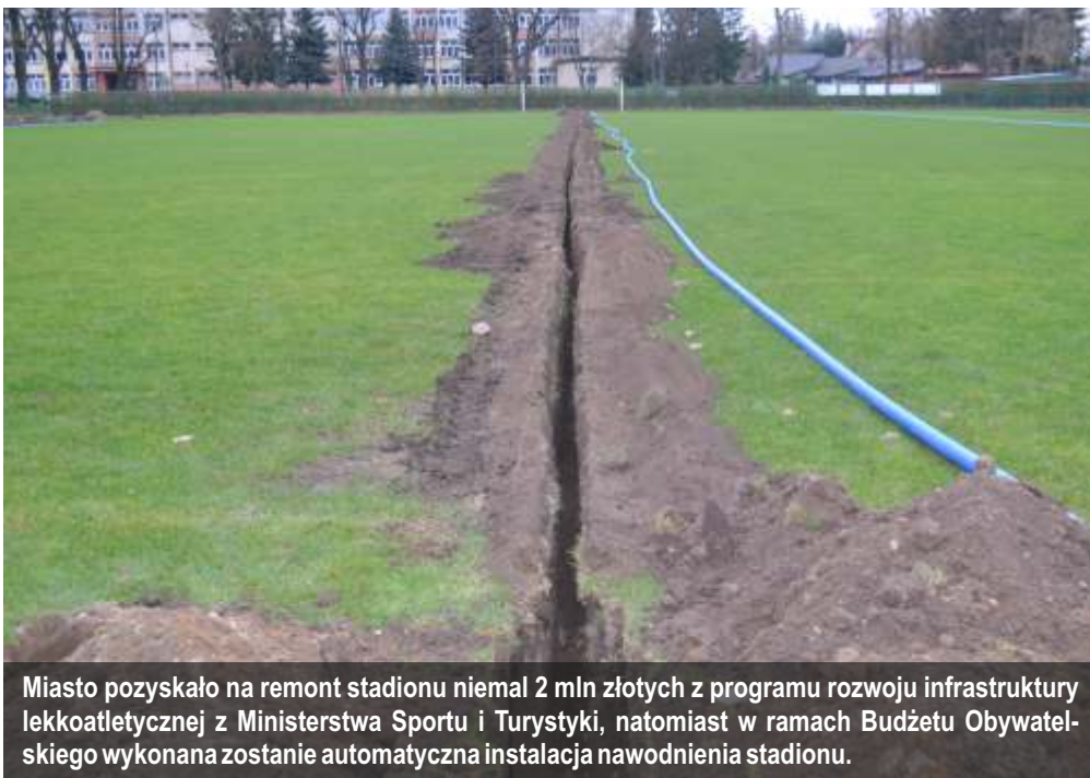
Miasto pozyskało na remont stadionu niemal 2 mln złotych z programu rozwoju infrastruktury lekkoatletycznej z Ministerstwa Sportu i Turystyki, natomiast w ramach Budżetu Obywatelskiego wykonana zostanie automatyczna instalacja nawodnienia stadionu.