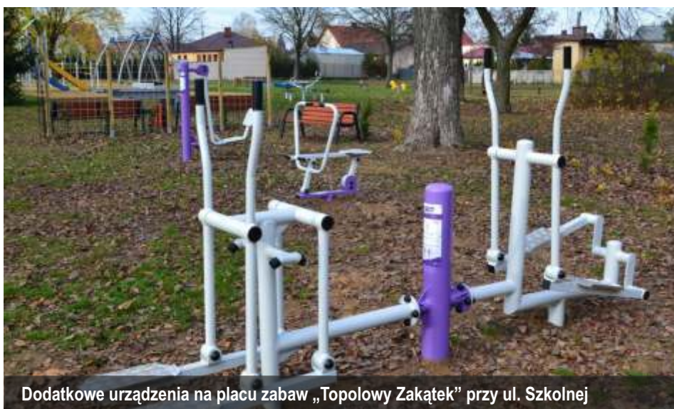
Dodatkowe urządzenia na placu zabaw „Topolowy Zakątek” przy ul. Szkolnej

Miasto uzyskało 75 tys. złotych dofinansowania na dwa zadania - sprawnościowy plac zabaw wraz z ogrodzeniem z siłownią plenerową przy ulicy Lubiejewskiej oraz strefę relaksu z siłownią plenerową przy ul. Szkolnej. Wykonawcą obu zadań była firma Ogrody Robert Liżewski z Ostrowi Mazowieckiej.