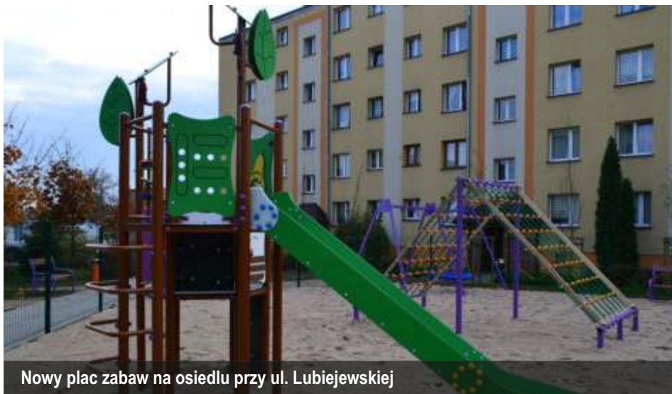
Nowy plac zabaw na osiedlu przy ul. Lubiejewskiej

Powstała siłownia zewnętrzna na placu zabaw „Topolowy Zakątek” oraz siłownia zewnętrzna i plac zabaw na osiedlu przy ul. Lubiejewskiej. To dzięki dofinansowaniu jakie Miasto uzyskało z programu Rozwój małej infrastruktury sportowo – rekreacyjnej o charakterze wielopokoleniowym w ramach Otwartej Strefy Aktywności Ministerstwa Sportu i Turystyki. Strefy są ogólnodostępne i bezpłatne.