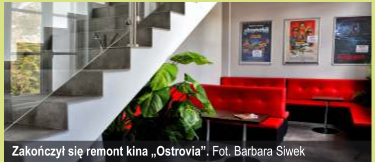
Zakończył się remont kina „Ostrowia”.