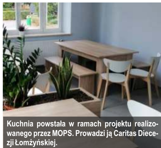
Kuchnia powstała w ramach projektu realizowanego przez MOPS. Prowadzi ją Caritas Diecezji Łomżyńskiej.

Od 7 października podopieczni Miejskiego Ośrodka Pomocy Społecznej mogą już korzystać z Kuchni Miejskiej. Posiłki można skosztować na miejscu w budynku przy ul. 3 Maja 57 lub wziąć na wynos.