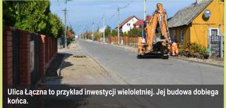
Ulica Łączna to przykład inwestycji wieloletniej. Jej budowa dobiega końca.