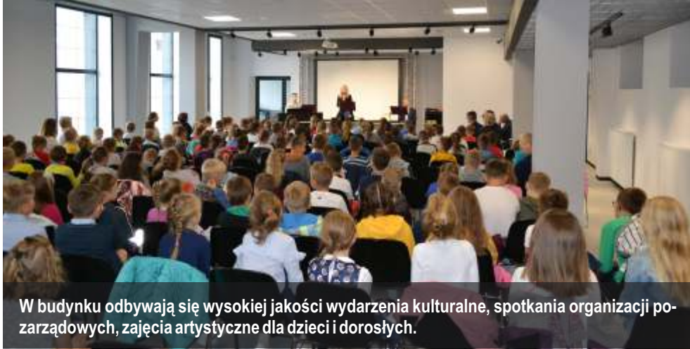
W budynku odbywają się wysokiej jakości wydarzenia kulturalne, spotkania organizacji pozarządowych, zajęcia artystyczne dla dzieci i dorosłych.

Dawna elektrownia miejska znów stanowi ważne źródło generowania energii, tym razem nie elektrycznej, lecz ludzi pełnych pasji. Zrewitalizowany budynek elektrowni przy ul. 11 Listopada 7 to miejsce spotkań mieszkańców miasta oraz gości. Stanowi odpowiedź na rosnące zapotrzebowanie społeczeństwa na usługi świadczone przez ośrodki związane z kulturą, czytelnictwem, dziedzictwem narodowym.