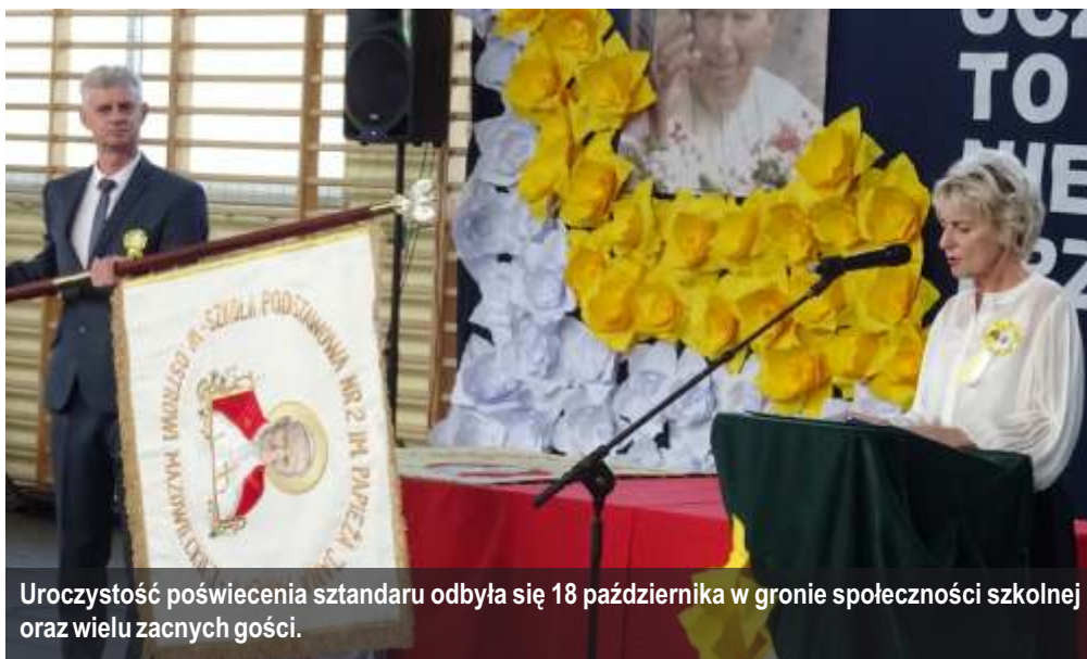
Uroczystość poświęcenia sztandaru odbyła się 18 października w gronie społeczności szkolnej oraz wielu zacnych gości.