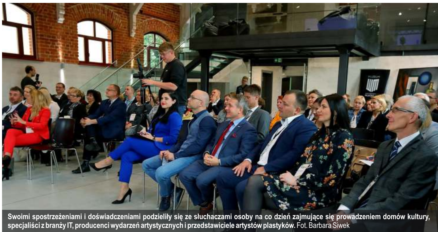
Swoimi spostrzeżeniami i doświadczeniami podzieliły się ze słuchaczami osoby na co dzień zajmujące się prowadzeniem domów kultury, specjaliści z branży IT, producenci wydarzeń artystycznych i przedstawiciele artystów plastyków.