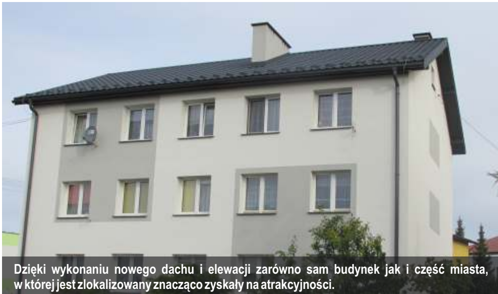
Dzięki wykonaniu nowego dachu i elewacji zarówno sam budynek jak i część miasta, w której jest zlokalizowany znacząco zyskały na atrakcyjności.

Zmodernizowano budynek Wspólnoty Mieszkaniowej przy ulicy B. Prusa 68. To jeden z wielu budynków wielorodzinnych administrowanych i zarządzanych przez Towarzystwo Budownictwa Społecznego.