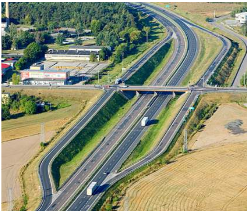
Via Baltica łączyć będzie kraje nadbałtyckie z Europą Zachodnią. Na trasie drogi ekspresowej S 61 znajdzie się też Ostrów Mazowiecka.

Jak podała Generalna Dyrekcja Dróg Krajowych i Autostrad w Białymstoku 21 listopada, w wyniku przeprowadzonego przetargu, wybrana została firma, która wybuduje odcinek S 61 Via Baltica od węzła Podborze koło Ostrowi Mazowieckiej do węzła Śniadowo. Wykonawcą tego odcinka trasy będzie firma POLAQUA.