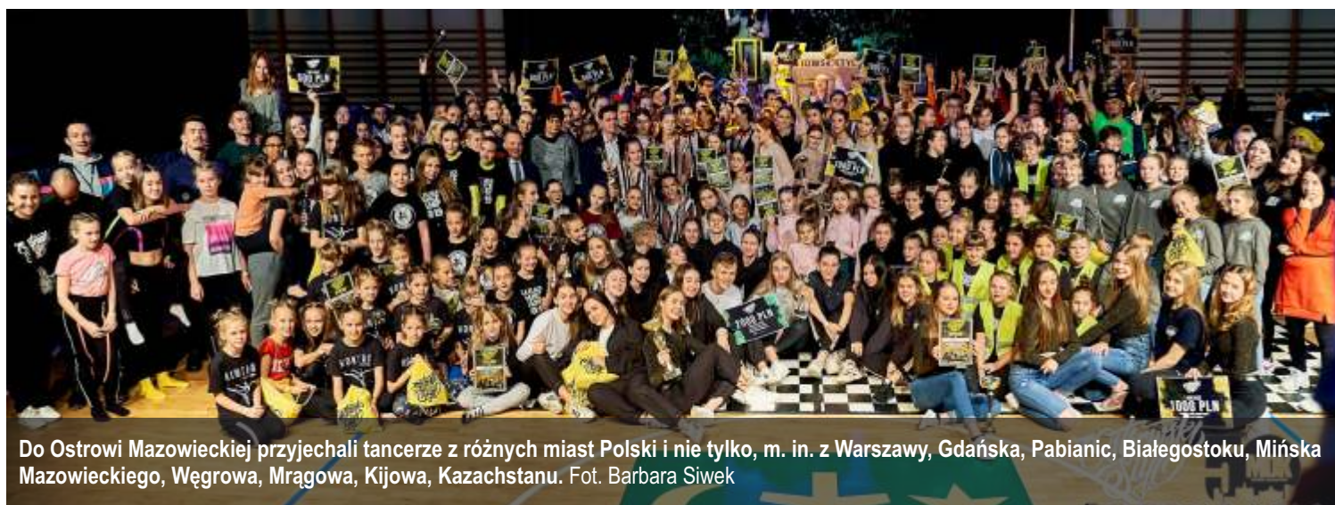
Do Ostrowi Mazowieckiej przyjechali tancerze z różnych miast Polski i nie tylko, m. in. z Warszawy, Gdańska, Pabianic, Białegostoku, Mińska Mazowieckiego, Węgrowa, Mrągowa, Kijowa, Kazachstanu.