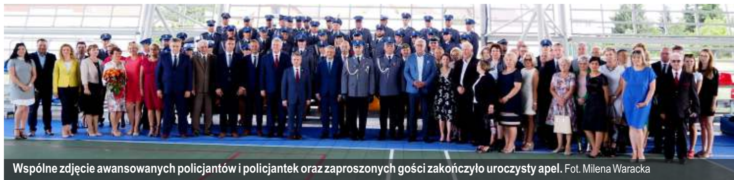
Wspólne zdjęcie awansowanych policjantów i policjantek oraz zaproszonych gości zakończyło uroczysty apel.