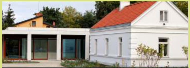
Zakończył się etap budowy Muzeum Dom Rodziny Pileckich, rozpoczęło się tworzenie wystawy stałej.